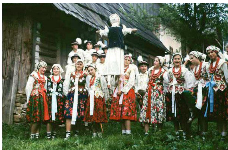
Tradycyjna Marzanna.

Tradycja topienia Marzanny przetrwała do dziś i jest przestrzegana w wielu regionach Polski. Topienie kukły ma miejsce 21 marca, czyli w pierwszy kalendarzowy dzień wiosny. Marzannę ubiera się w łachmany lub strój ludowy, a w niektórych miejscowościach zastępuje ją męski odpowiednik – Marzaniok!